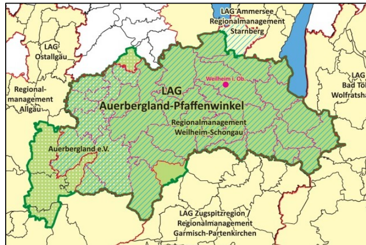
Abb. 2: Gebiet der LAG Auerbergland-Pfaffenwinkel

Damit hat das LAG-Gebiet einen Umfang von 1.103,55 km 2 und 149.652 Einwohner (31.06.2023).